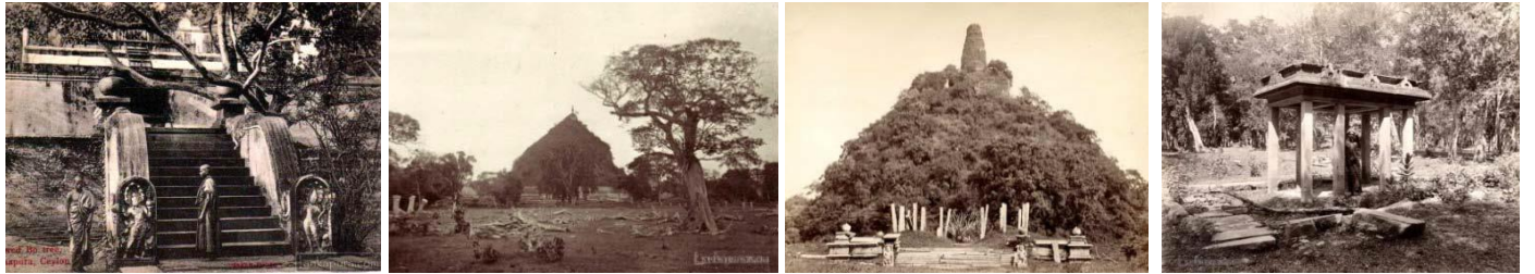
(උපුටාගැනීම “දිනිති” සගරාව)

අනුරාධපුරය ගැන ලීස්චින් තැබූ සමරු සටහන් නිසා “ඇත හා මෑත පෙරදිග පසුගාමී රටවල්” ලෙස බටහිර ලෝකය හඳුනාගෙන තිබූ රටවල ඉතිහාසය හා පුරාවිද්‍යාව ගැන ඔවුන් තුළ නව ප්‍රබෝධයක් ඇති විය. ඉන්දියාවේ හා ශ්‍රී ලංකාවේ ශ්‍රේෂ්ඨ උරුමයන් වෙත නිරායාසයෙන් ම ඔවුන්ගේ විශේෂ අවධානය යොමු විය. ඉන්දියාවේ පුරාවිද්‍යා ගවේෂණ අංශය 1868 දී ස්ථාපිත කෙරුණු අතර ඉන් වසර 7කට පසු ශ්‍රී ලංකාවේ වනගත හුදකලා පෙදෙස්වල තිබූ වැළලුණු නගර හා ධනනිධාන ගැන තොරතුරු රැස්කිරීම ඇරඹිණි. එය බ්‍රිතාන්‍යන්ට මහත් ආශ්වාදජනක කටයුත්තක් විය. එවකට ගවේෂණ අධ්‍යක්ෂ ලුතිනන් කර්නල් ගයර්, ස්මාරක සංරක්ෂණය අරඹුවා පඬුණක් නොව පුරාවිද්‍යාව පිළිබඳ ව ශ්‍රී ලාංකිකයන්ගේ උදෙසාගය ද අවුළුවා ලිය. ශ්‍රී ලංකාවේ පුරාවිද්‍යාව අවශ්‍යයෙන් ම අසහාය මුනිවර බුදුන්ගේ ඉගැන්වීම්, බ්‍රාහ්මන දේව ඇදහිලි, පූර්ව බෞද්ධ සත්ව වන්දනය හා අවියෝජනීය ව බැඳී පවතියි. තවමත් ජීවමාන ආගම් දෙකක් මේවායෙන් සංකේතවත් වෙයි. එම නිසා මෙරට ජනගහණයෙන් බහුතරය මෙම නටඹුන් සලකනුයේ පුරාතන ශිෂ්ටාචාරයක් සනිටුහන් කරන ඓතිහාසික විද්‍යාත්මක සාක්ෂ්‍ය ලෙස නොව සිය ආගමට අයත් ලෝකායත, පූජනීය ස්ථාන ලෙසයි. කලකට ඉහත මළ ආගම් සහිත රටවල කරන අධ්‍යයනවල දී තරම් ඉක්මනින් ශ්‍රී ලංකාවේ පුරාවිද්‍යා අධ්‍යයනයන් හා සංරක්ෂණයන් කළ නොහැක්කේ එහෙයිනි.